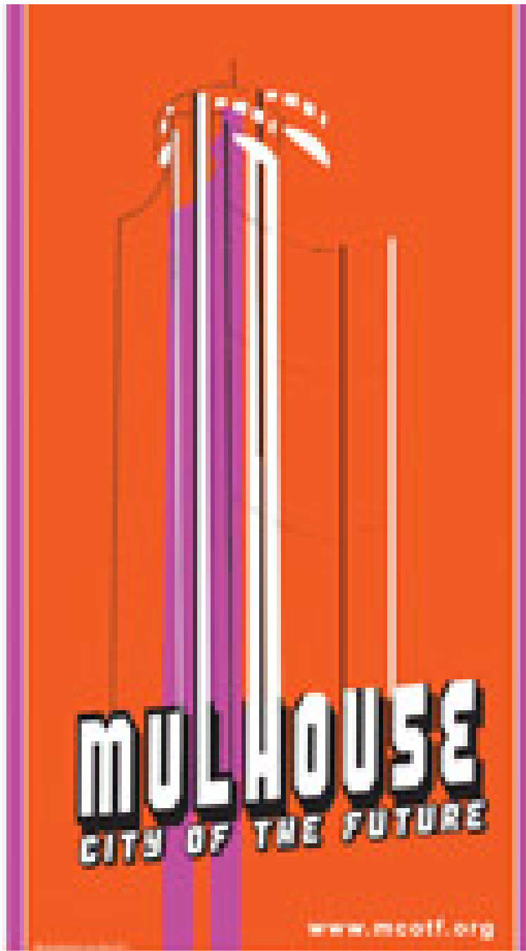
Affiche d'un des événements (et aussi objets culturels) ayant utilisé la Tour de l'Europe comme objet de leur communication ; ici le festival Mulhouse City of The Future (2006)