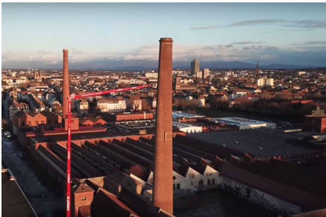
Vue de l'installation de l'antenne DAB+ initiée par Π Node pour permettre de façon indépendante à des radios d'être diffusées à Mulhouse ; la Tour de l'Europe et la Forêt noire dans la perspective ;

AVEC LA RADIO , une programmation en matière d'art radiophonique et ouverte au public, proposer une expérience de l'ordre du sensible : la hauteur et l'expérience de la hauteur, l'écoute et le cinéma pour les yeux. Donner corps à l'espace public radiophonique, à l'agora médiatique en élargissant le champ des actions de ce médium au domaine le plus large de l'art radiophonique, en y proposant la variété des propositions possibles prises sous le prisme radiophonique.