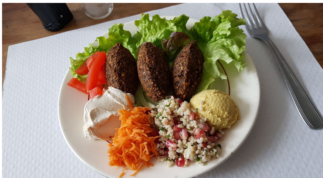
L'ambition culinaire consiste à proposer une cuisine simple, abordable et essentiellement végétale. Composée en majorité avec une matière issue du circout-court (Dreyeckland) ;

PAR LA RESTAURATION sa carte, les invitations lancées à des chef-fes du Dreyeckland ou encore un espace pour accueillir des partenaires de l'insertion professionnelle de la restauration. De façon complémentaire et intriquée, produire une programmation à la fois radiophonique et culinaire qui incitera, tout en les impliquant régulièrement dans la programmation conjointe aux deux médiums. Et proposer ainsi aux mulhousien-ne-s de se réapproprier cet espace dorénavant propriété de la Ville.