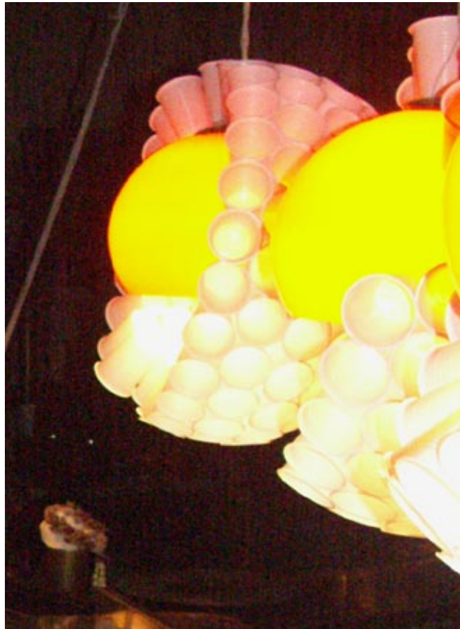
Luminaires au Nummer Sieben à Mulhouse

Spectral : des ondes terrestres aux ondes lumineuses, en passant par l'ensemble des ondes radiophoniques ( au sens très large), la télécommunication ; la Tour de l'Europe est source de lumière, de son. Durant toutes les saisons programmées en son sein, la Tour est au centre des attentions mulhousiennes. Elle est visible par toutes et tous. Un éclairage vers l'extérieur afin de donner vie de façon visible à la programmation. Certaines productions visuelles accompagneront les programmes radiophoniques proposés au public mulhousien. A l'intérieur, le restaurant fera l'objet d'une attention particulière de ce point de vue. En lien avec la programmation artistique et gastronomique, parfois en programmation visuelle propre et durant les nuits. L'intérieur du restaurant sera l'objet de vidéo-projections toujours différentes sur les murs à la façon d'un papier-peint. Dit autrement, il s'agit d'une volonté de porter une attention singulière à la scénographie du lieu et de son environnement.